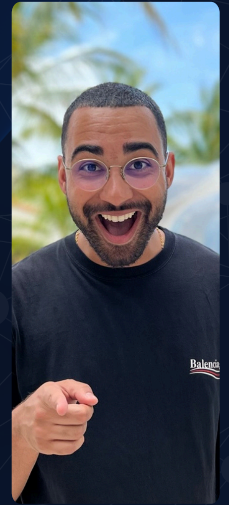
Guillaume G. Stratégie & inconscient