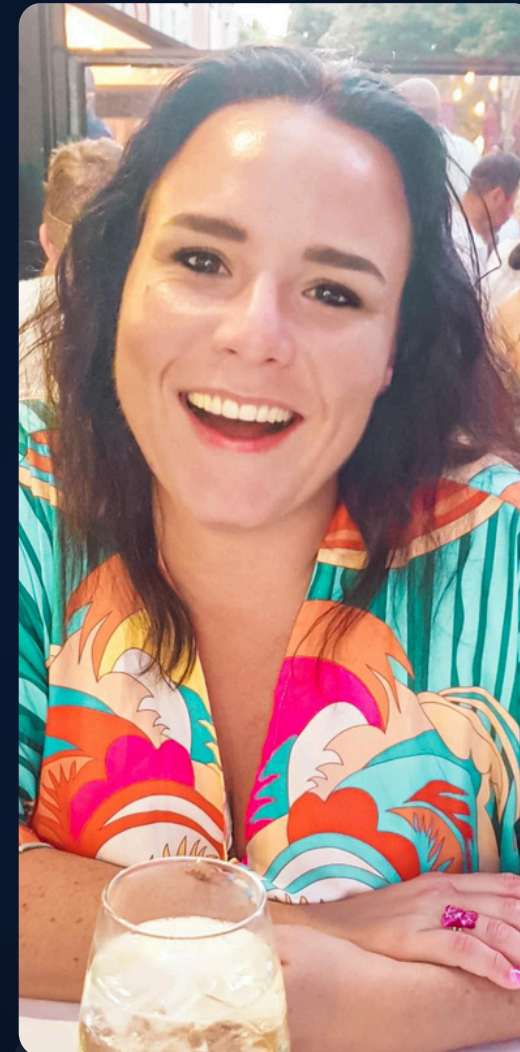
Nathalie V. Peurs & actions Séances groupe