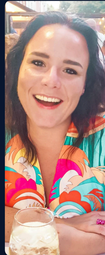
Nathalie V. Peurs & actions