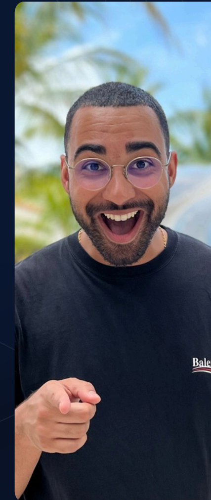
Guillaume G. Strategie & inconscient