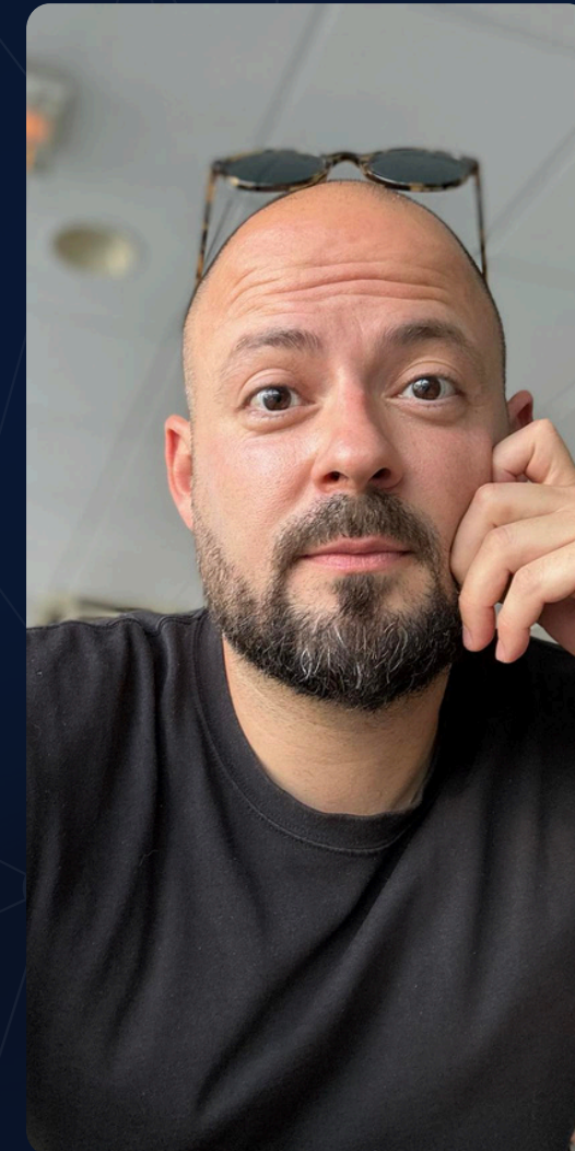
Julien B. Marketing authentique Séances 1:1 Formation E-learning